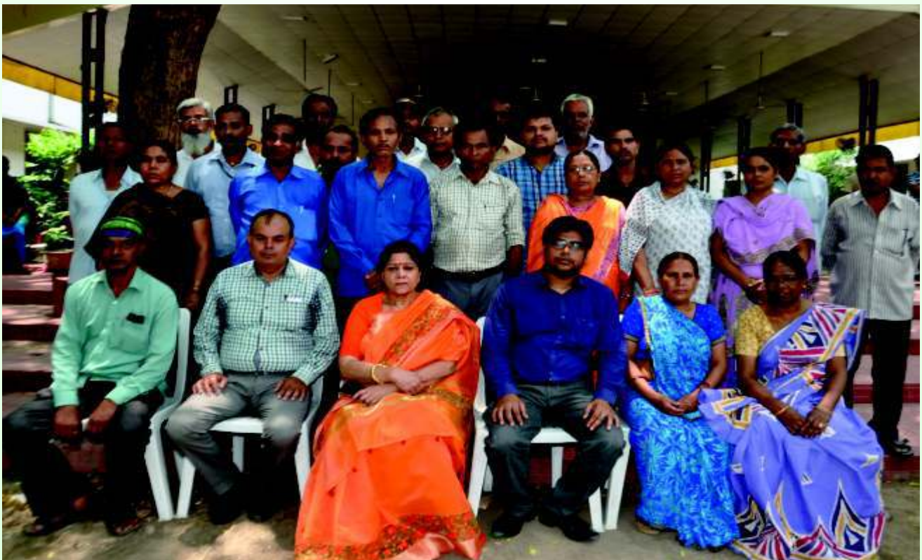
प्राचार्य एवं कॉलेज के कर्मचारीगण