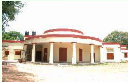
महाविद्यालय का सबसे पुराना भवन