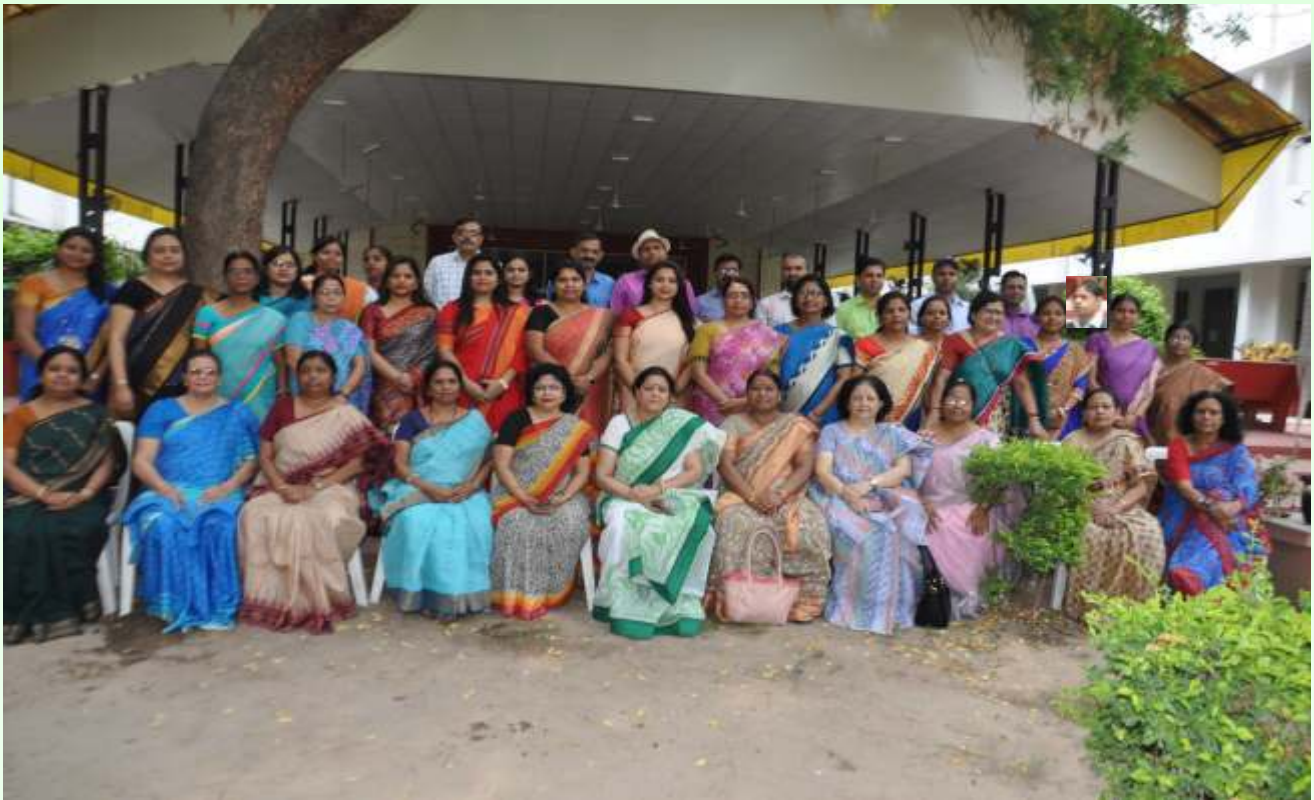
प्राचार्य के साथ कॉलेज की शिक्षिकाएँ एवं शिक्षक